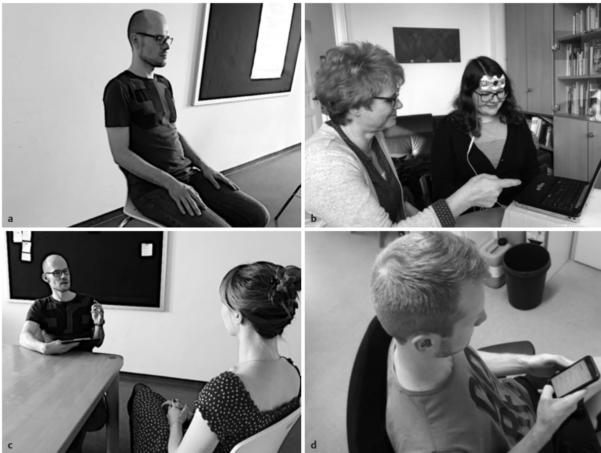
► Abb. 2 Anwendungsbeispiele psychologischer Methoden in der Behandlung von Kopfschmerz: a – angeleitete Entspannungsverfahren, b – elektromyografisches Biofeedback, c – Einzelsitzung KVT, d – neue Technologien (z. B. Migräne-App).

choedukation, syndromspezifische KVT (z. B. Verfahren zur Bewältigung von Attackenangst, Attackenmanagement, störungsspezifische Lebensstilempfehlungen wie Ausdauersport), sonstige Ansätze wie z. B. psychodynamische Verfahren, Akzeptanz- und Commitmenttherapie (ACT). Eine Klassifikation psychologischer Verfahren zur Behandlung von Kopfschmerzen wurde bislang von verschiedenen Autoren vorgenommen [1, 22–24]. Letztendlich stellen die genannten Kategorien keine klar abgrenzbaren Bereiche dar. So sind psychoedukative Elemente meistens auch anderen Ansätzen immanent (z. B. Psychoedukation vor Durchführung von Biofeedback). Auch weitere Kategorien beinhalten Elemente aus anderen Bereichen (z. B. umfasst das Triggermanagement KVT zur Stressbewältigung). Während für einige Verfahren (Entspannung, KVT zur Stressbewältigung, Biofeedback) bei bestimmten Kopfschmerzerkrankungen (hier: Migräne) die Evidenzlage durchaus gut ist [1], fehlen für andere Verfahren respektive andere Kopfschmerzerkrankungen noch jegliche Evidenznachweise. Auch wenn die syndromspezifischen KVT-Verfahren augenscheinlich sinnvoll und oft indiziert sein dürften (z. B. Verbesserung des Attackenmanagements), gibt es kaum Nachweise für deren Effektivität. Empirische Belege zur Wirksamkeit einzelner Verfahren