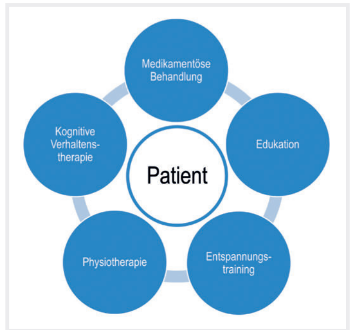
► Abb. 3 Komponenten der interdisziplinären multimodalen Kopfschmerzbehandlung (nach [60, 62])

Seit den 1990er-Jahren wurden und werden diesbezüglich zunehmend spezifischere Verfahren entwickelt: z. B. MIDAS (Migraine Disability Assessment Scale [106]), IBK (Inventar zur Beeinträchtigung durch Kopfschmerzen [105]), HIT-6™ (Headache Impact Test [103, 104]) zur Beurteilung der kopfschmerzbedingten Beeinträchtigung sowie HTSAQ-G (Headache Triggers Sensitivity and Avoidance Questionnaire [65]), HMSE-G (Headache Management Self-Efficacy Scale [66]). Aktuell befindet sich ein Testverfahren zur Erfassung von Belastung, Beeinträchti-