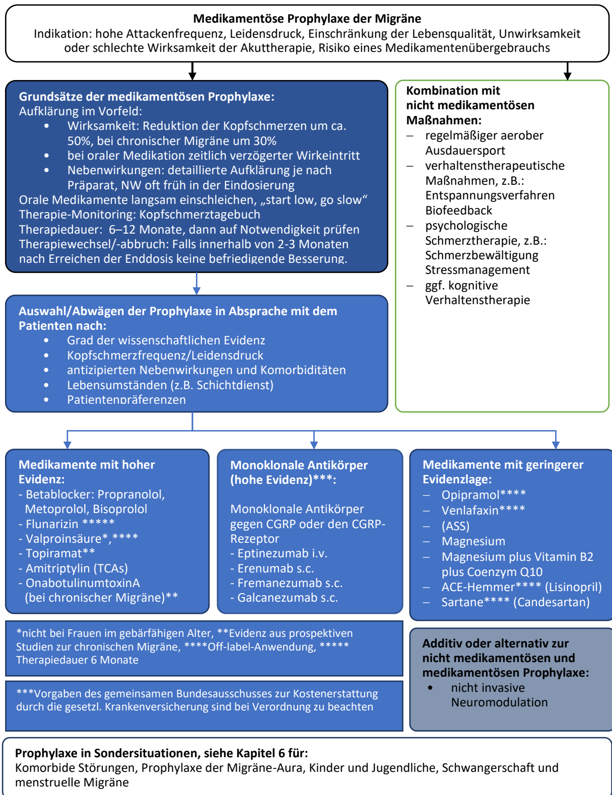
Abbildung 2. Medikamentöse Prophylaxe der Migräne